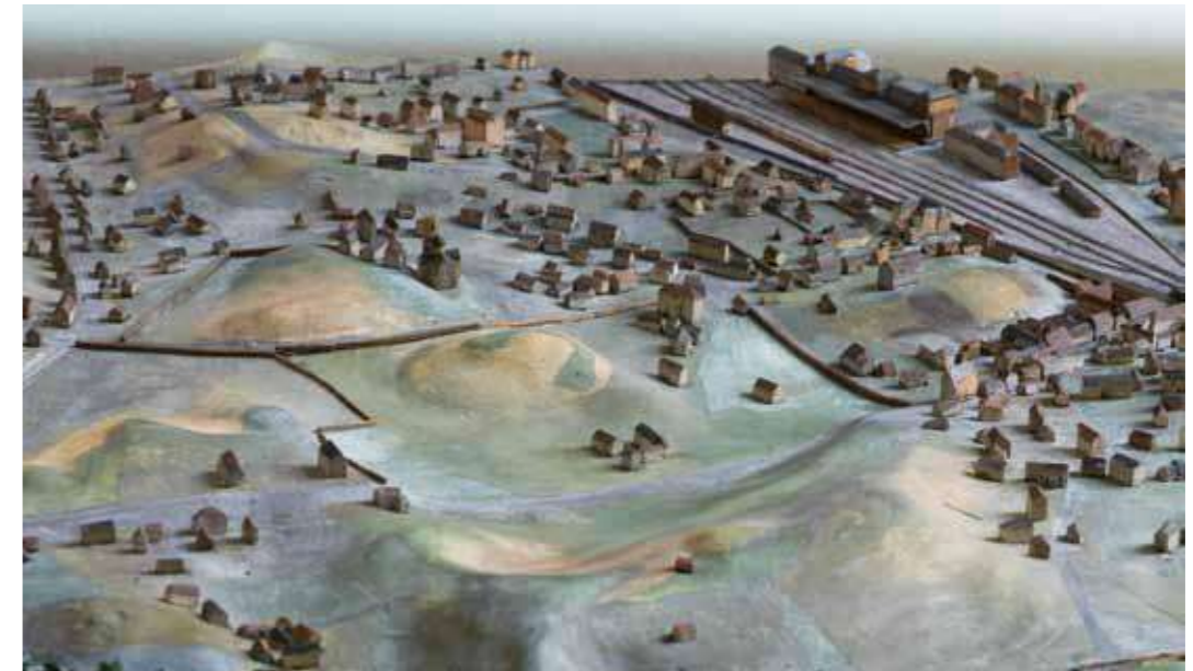
Restauruotos Plastinio Vilniaus plano plokštės (VŽM 6526/4) fragmentas. Plokštės autorius - Samuelis (Stanley) Wulcas. Restauravo B. Kunkulienė. (4)

Tad, deja, autentiško Plastinio Vilniaus plano vaizdo – tokio, koks jis buvo sukurtas gete gyvenusių žmonių, savo srities specialistų ir profesionalų – architektų, inžinierių, skulptorių ir dailininkų, – mes niekada nebeišvysime. Bet reikia dėjuotis, kad buvo išsaugota bent kruopelytė šio milžiniško kadaise Vilniaus gete atlikto darbo, kuris šiandien mums svarbus ne kaip tikslus kartografinis plastinis Vilniaus žemėlapis, kurį savo reikmėms užsakė naciai, bet kaip jį kūrusių ir visų kitų Vilniaus geto gyventojų atminimas. Kaip dalelė Vilniaus geto istorijos, kuri yra Vilniaus ir visos Lietuvos istorijos dalis ir kurios niekada negalima pamiršti.