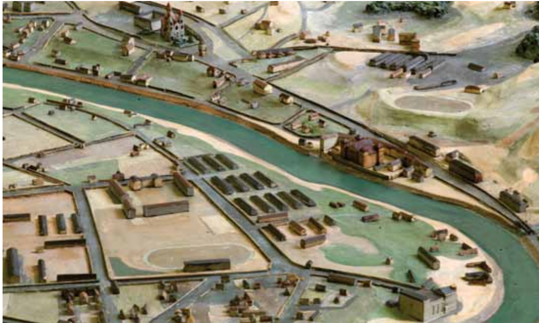
Restauruotas Plastinio Vilniaus plano plokštės (VŽM 6526/2) fragmentas. Restauravo B. Kunkulienė 2013 ir 2015 m. (6)

Geto mokyklos šiandiena ėjo žiūrėti bareljefinio Vilniaus miesto žemėlapių, kuris gaminamas Vilniaus gete kaip dovana gebitskomisarui. Žemėlapis užims 20 m 2 . Pats sunkiausias darbas jau padarytas. Tačiau tai, kas padaryta, iš tiesų tėra maža miesto dalis. Vis dėlto tai yra pati svarbiausia ir pati sunkiausia darbo dalis. Ant stalo po reflektorių priešais mus guli Vilniaus miesto centras. Ant gipso plokščių kiekvienas namas, kiekviena maža gatvelė čia pažymėta atsižvelgiant į nurodytą mastelį – 1 m = 2500. Viskas puikiai nuspalvinta, atlikta nepaprastai gražiu stiliumi. Vaikai spraudėsi pirmyn, kad pažiūrėtų į žemėlapi ir, žinoma, kiekvienas ieškojo savo namo, savo mažos gatvelės, iš kurios jis atėjo į getą. Inžinierius Guchmanas mums viską paaiškino: Vilija, Žalioji tiltas, Šnipiškės, o čia – katedra. Vaikai godžiai žvelgė į nuostabias kalnuotas mažas gatveles aplink Viliją ir Vilnelę, iš kurių jie buvo išvaryti. Bareljefinis Vilniaus žemėlapis yra neabejotinai didis meno kūrinys, kuriuo mes galime didžiuotis, nes jis nebuvo sukurtas už geto ribų. Tiek daug pastangų ir kantrybės įdėta į šį darbą, kiek tik tai žydas gali jų turėti šiais laikais. Kadangi tai yra mūsų darbas, mes galime neabejoti, kad išvysime gražias Vilniaus gatves ne tik žemėlapyje, bet ir tikrovėje. 24