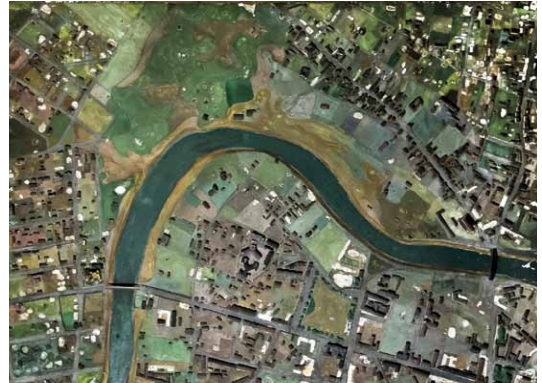
Plastinio Vilniaus plano plokštė (VŽM 6526/1) prieš restauravimą. 2013 m. (2)

tų elementų buvo visai atsiklijavę nuo maketo pagrindo, didelė dalis architektūrinių elementų neišlikusi. Restauruojant plokštės buvo nuvalytos, sutvirtintos, priklijuoti architektūriniai elementai, atkurtas prarastas polichrominis sluoksniu, atlikti cheminiai klijų tyrimai.