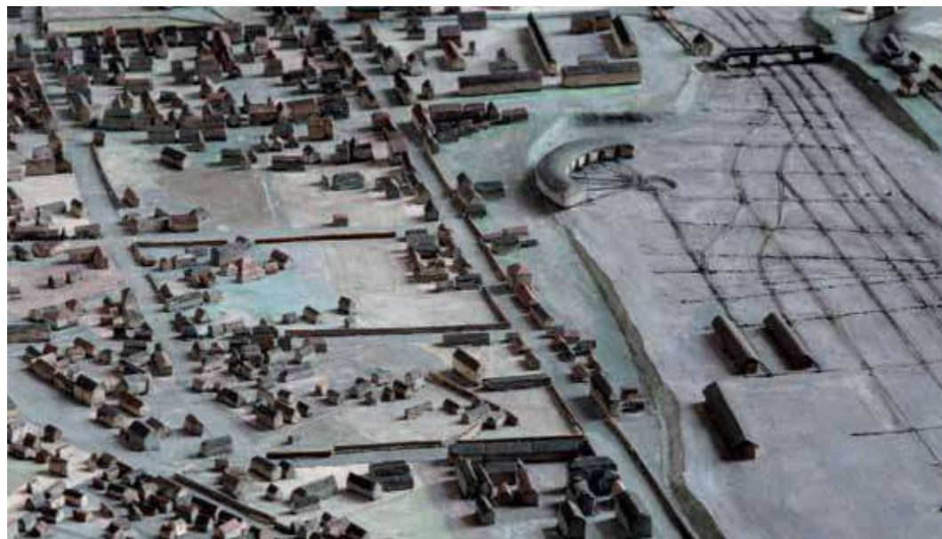
Restauruotos Plastinio Vilniaus plano plokštės (VŽM 6526/3) fragmentas. Restauravo B. Kunkulienė. Fotografavo P. Račiūnas 2015 m. (3)

Būtina paminėti ir dar vieną su Vilniaus maketo restauravimu susijusią aplinkybę – apie trisdešimt architektūrinių elementų liko nepritvirtinti prie maketo plokščių pagrindų, nes atsižvelgiant į ikonografinius, kartografinius ir lyginamuosius tyrimus padaryta prielaida, kad šie savo pavidalu išskirtiniai elementai gali būti iš kitų, neišlikusių, Plastinio Vilniaus plano plokščių – labiausiai tikėtina, kad iš dviejų centrinę Vilniaus miesto dalį vaizdavusių plokščių, kurios, kaip pavyko nustatyti, buvo prarastos vėliausiai.